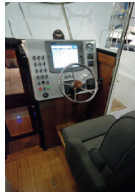
34 SW:n kojelauta on uuden sukupolven Deltoille tunnusomainen ja korostaa Deltojen yksilöllisyyttä. 12-tuumainen plotteri kuuluu vakiovarusteisiin.

Toista tulemistaan Suomen markkinoille tekevän Deltan hinnoittelu on osunut varsin hyvin kohdalleen. 34 SW:stä pyydettävä 254 000 euroa on paljon rahaa, mutta kilpailijoihin suhteutettuna kuitenkin varsin kilpailukykyinen summa. Samalla moottorilla varustetuista kilpailijoista esimerkiksi Minor Offshore 34:n ja uuden Nimbus 365 Coupén läh-