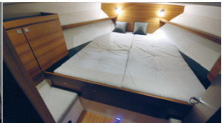
Keulassa on ”täysimittainen” omistajapariskunnan makuukajuutta.