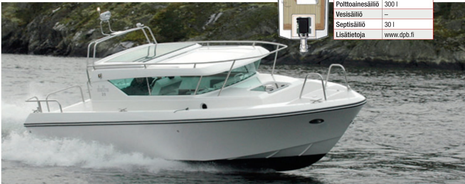
Delta 29 SW on solakkalinjainen ajajan vene. Ohjaamo on aivan kajuutan takaosassa ja kattoluukku avautuu eteenpäin.