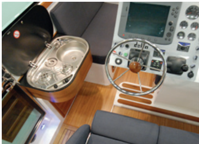
Paapuurin laidalta esiin vedettävä pentterimoduuli on lisävaruste. Työskentelytila pentterin ääressä jää vaatimattomaksi ja kulkuyhteys kajuutan ja avotilan välillä hankaloituu.

terin lisäksi muun muassa keula-potkuri, ajonaikainen lämmitin, trimmitasot, vesi-wc ja septitankki sekä kiinnittymisvarustepaketti.