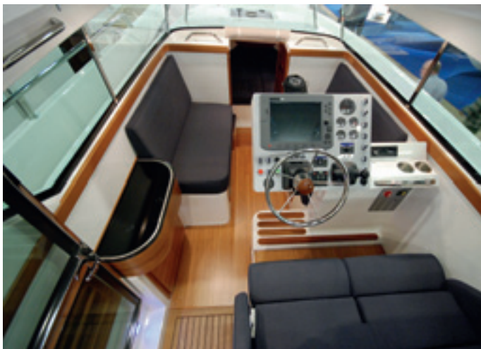
29 SW:n sisätalajärjestely on ohjaamon etupuolella sijaitsevan matkustamon myötä totutusta poikkeava, mutta Deltat tunteville malliston pienimmästä, 25 SC -mallista tuttu.

vuutena. Kun ajotuntuma on välitön sekä veneen reagointi ohjaukseen, kaasuun ja trimmeihin nopeaa ja selkeää, on 29 SW:tä ilo käskyttää.