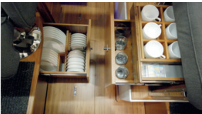
Sohvan päädyn ja kipparin istuimen jalustoista löytyy tehtaalla valmiiksi täytetyt astiakaapit.

Kojelaudan kytkimet ovat hyvin käsillä, mutta kaasuvipu sijaitsee hieman ahtaasti ratin ke-